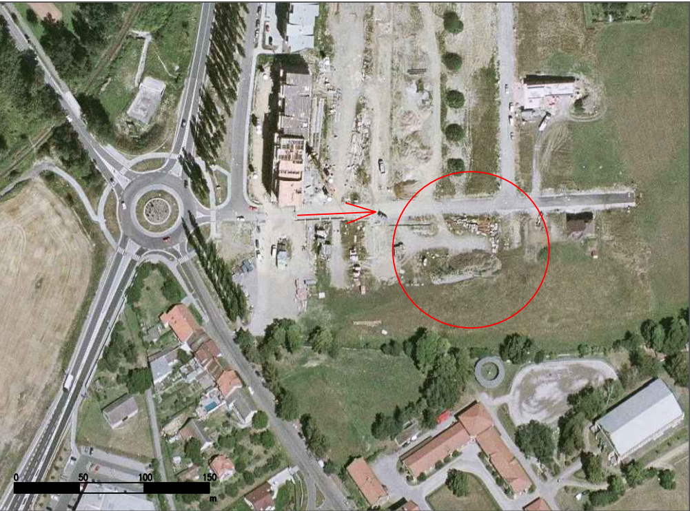
SEZNAM POZEMKŮ OKOLNÍCH A DOTČENÝCH STAVBOU